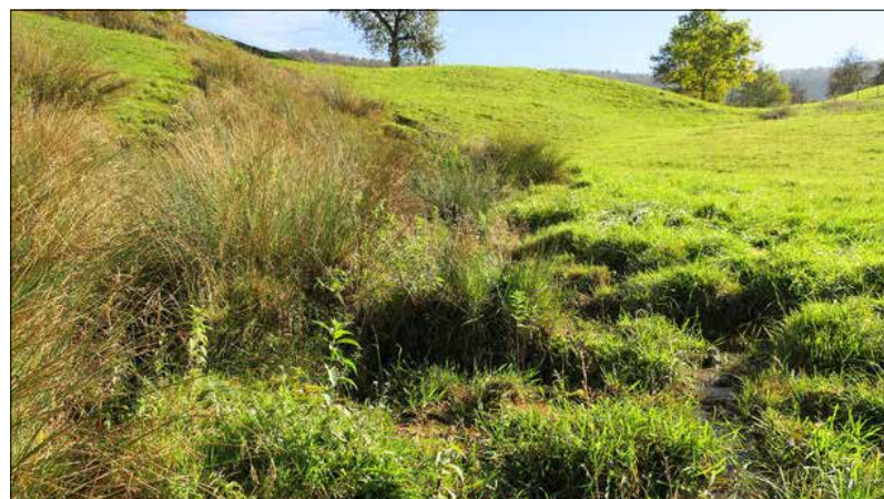
L'inventaire des sources, mené par la biologiste Carine Beuchat pour le Parc du Doubs, est désormais terminé. Ici, des ruisseaux se forment sous une source.

Au vu de ces résultats, la renaturation et la protection de ces milieux apparaissent comme prioritaires, ceci dans le but de sauvegarder certaines espèces rares. A ce propos, l'utilisation du nouveau protocole de recensement fourni par le canton du Jura a permis de récolter plus de détails