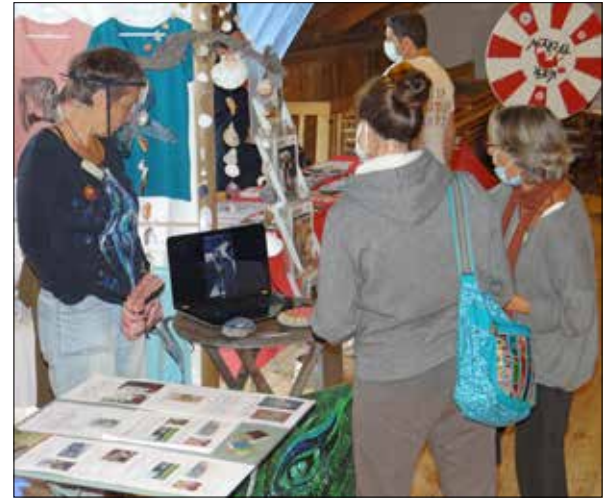
Masque ou visière sur la bouche, les yeux rivés sur la vidéo.

Hanté par le spectre du coronavirus, le salon Terr-Animale s'est tenu ce week-end à la halle-cantine de Saignelégier. Un peu moins de 900 visiteurs s'y sont déplacés. Moins qu'espéré. De quoi créer la grogne des organisateurs? Pas du tout. Les chevilles ouvrières se disent ravies d'avoir pu maintenir l'événement contre vents et marée... épidémique.