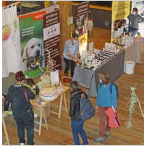
Des toutous jusque sur les affiches!