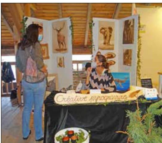
Quand la pyrogravure s'enflamme pour le monde sauvage.