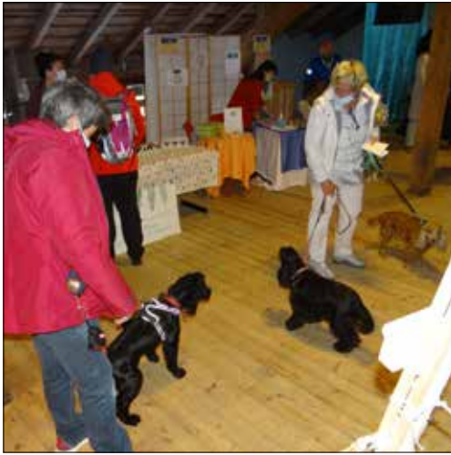
Rencontre entre Médor, Brutus et... Rex.