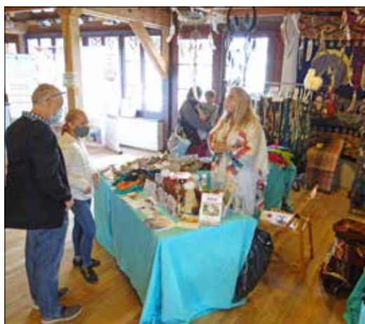
Attrapes-rêves et animaux totem.