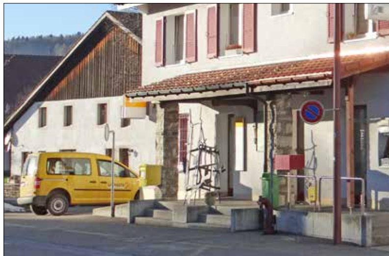
Désormais, le guichet de la Poste de Lajoux n'est plus ouvert que le matin, de 9 à 11 heures, du lundi au samedi. Le Géant jaune argumente une diminution constante de la fréquentation pour expliquer cette mesure.