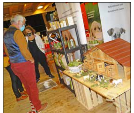
La ferme, dans sa version miniature.