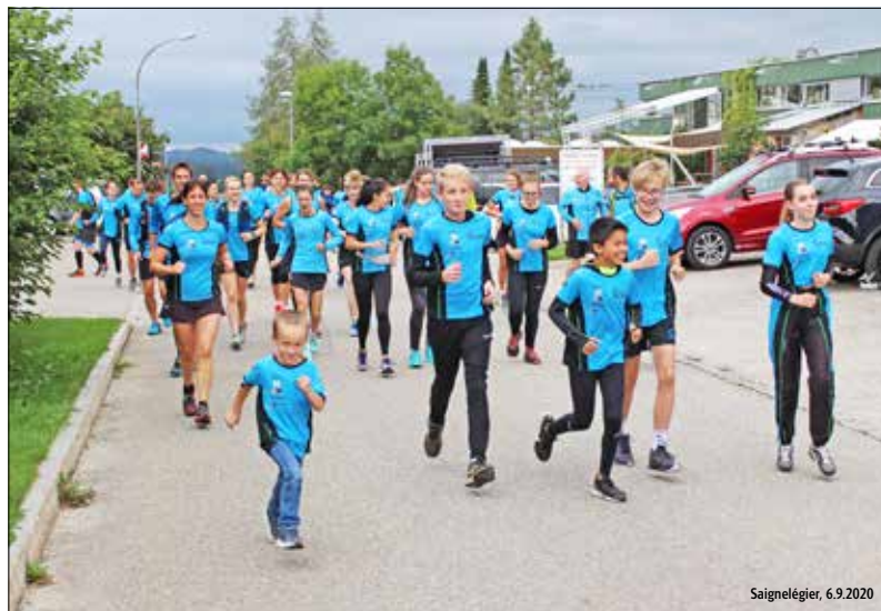
Une soixantaine de coureurs, essentiellement membres du Groupe sportif Franches-Montagnes, se sont relayés pour accomplir le Tour du Jura. Il aura fallu 35 h 35 aux différents groupes pour boucler les 239 km du parcours.

Le GSFM est parti de bon matin. Samedi, 5 heures, une poignée de mordus allument leurs lampes frontales au Noirmont. Direction Les Bois où, gentiment, le soleil annonce une belle journée. Un autre groupe prend alors la relève. Un passage de relais qui en appellera une vingtaine d'autres. Les maillots bleus et noirs